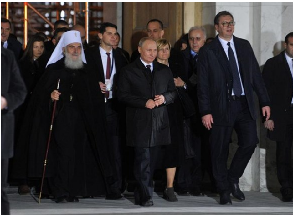
Patriarhul Irinej, A.Vučić, V.Putin, Beilgrad, 17.01.2019

În realizarea țintelor de asigurare a securității energetice, Belgradul a continuat proiectele cuprinse, practic, în acordul-cadru cu F.Rusă: ex-