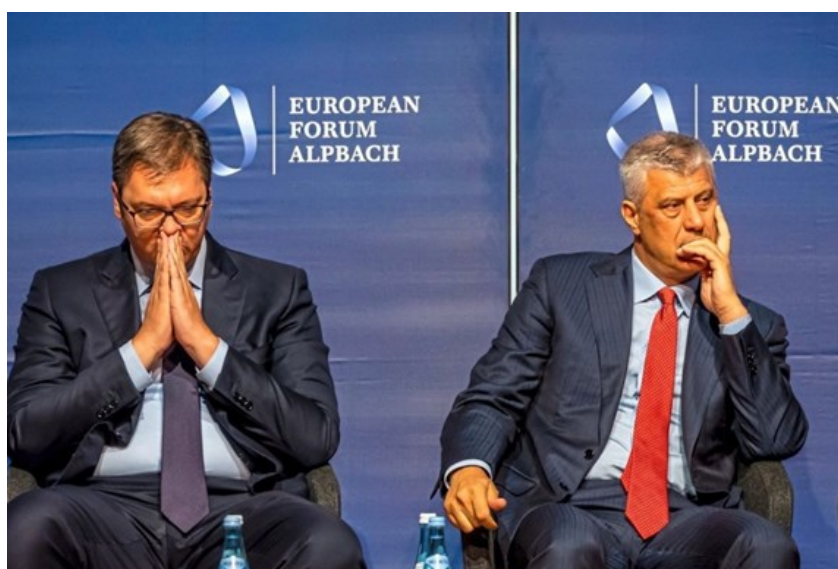
Aleksandar Vučić, Hashim Thaçi, Alpbach (Austria), august 2018

Este nevoie de identificarea clară a acestor probleme și de căutarea de soluții de compromis, care să reducă tensiunile și condițiile cu potențial conflictual. Una dintre astfel de soluții ar putea fi concentrarea pe elementele pentru care există consens și rezolvarea acelor probleme mai mici, pas cu pas, cu prezervarea promisiunii de reținere de la măsuri unilaterale și/sau violente și cu abordarea problemelor complexe și, cel puțin aparent, ireconciliabile într-o fază ulterioară, după (eventuale) evoluții fără incidente violente.