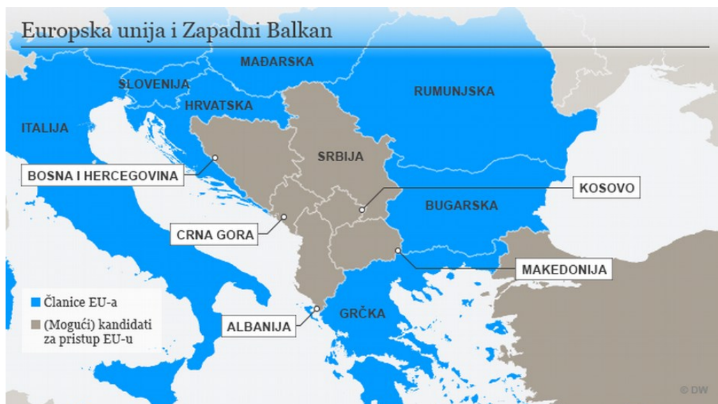
State membre ale UE (albastru) și state candidate la aderarea la UE (gri închis)

Între elementele comune se numără: baza de plecare, respectiv că avem de-a face, pe de o parte, cu un fost stat comunist, iar, pe de altă parte,