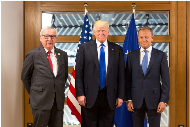
De la stânga la dreapta: președintele Comisiei Europene Jean-Claude Juncker, președintele Donald Trump și președintele Consiliului European Donald Tusk/Buxelles, 25 mai 2017

Europei și la întărirea legăturii transatlantice.