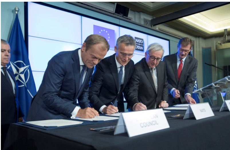
Semnarea Declarației comune privind cooperarea UE-NATO, 10 iulie 2018, Bruxelles 6

tății internaționale. Există încă suficientă coordonare și complementaritate între NATO și UE susținută de toți actorii implicați, fiind unanim recunoscut faptul că ambele organizații își păstrează autonomia decizională în problemele de apărare și securitate. Aceste aspecte vor fi probate în demersul de față, fiind evident faptul că Europa are nevoie de America de Nord la fel de mult cât America de Nord are nevoie de Europa . Iar acest lucru nu este posibil fără dezvoltarea legăturii transatlantice în domeniile securitate, apărare, politic și economic atât la nivelul NATO și UE. În plus, relațiile bilaterale ale SUA și Canadei cu UE și statele europene sunt cruciale pentru relevanța legăturii transatlantice, mai ales în domeniul securității și apărării.