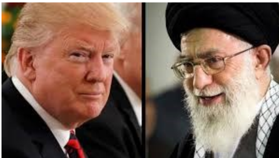
Președintele Donald Trump și Ayatollahul Ali Khamenei

seamnă și excluderea și obnubilarea gravității pe care o are o asemenea întrebare: va fi sau nu un al treilea război de amploare în Orientul Mijlociu și în extrema sa răsăriteană?